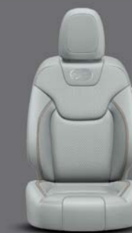
Overland Pearl Nappa Leder* Overland Pearl