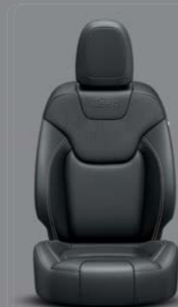
Morocco Nappa Leder* Schwarz