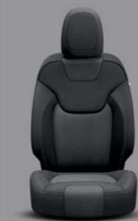
Morocco Stoff Schwarz