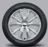
18" Leichtmetallfelgen (opt)