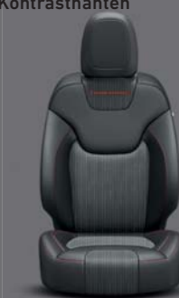
Morocco Black Mikrofaser/ Leder* Schwarz mit roten Kontrastnähten