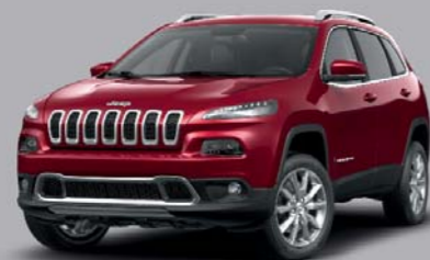
Deep Cherry Red