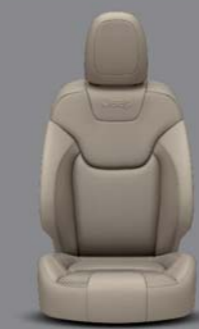
Nepal Nappa Leder* Light Frost Beige

*Leder kombiniert mit hochwertiger Ledernachbildung