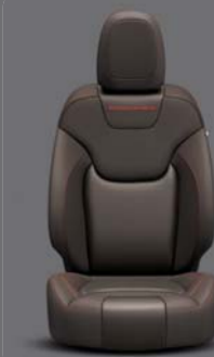
Grand Canyon Nappa Leder* Braun mit roten Kontrastnähten