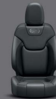
Overland Schwarz Nappa Leder*