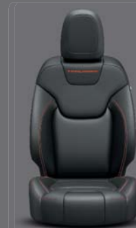
Morocco Nappa Leder* Schwarz mit roten Kontrastnähten